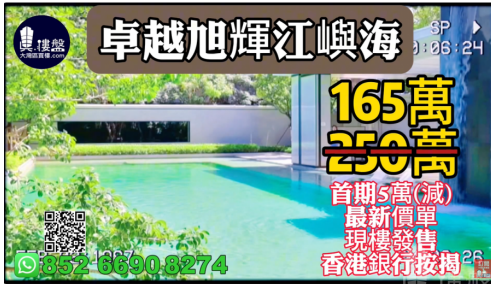
珠海卓越旭輝江嶼海，首期5萬(減)，30分鐘到港珠澳大橋關口，香港銀行按揭，最新價單